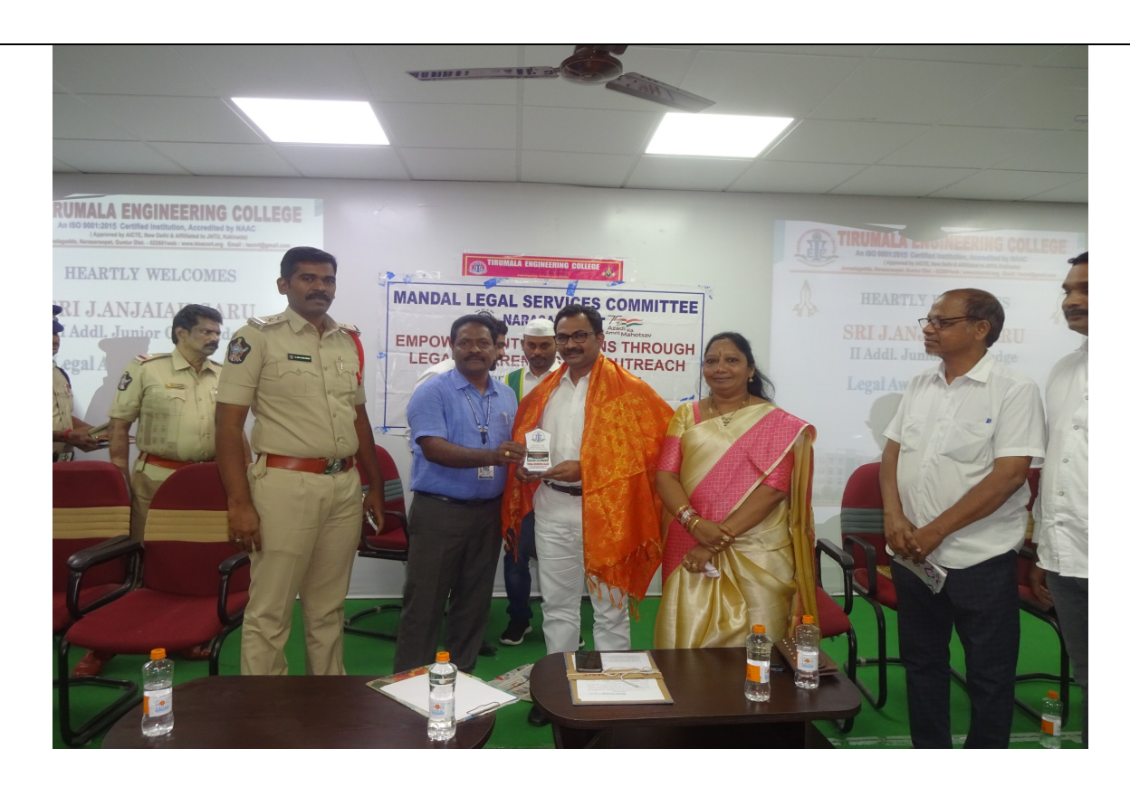
Principal sir felicitating the Disha Police and Magistrate of the District