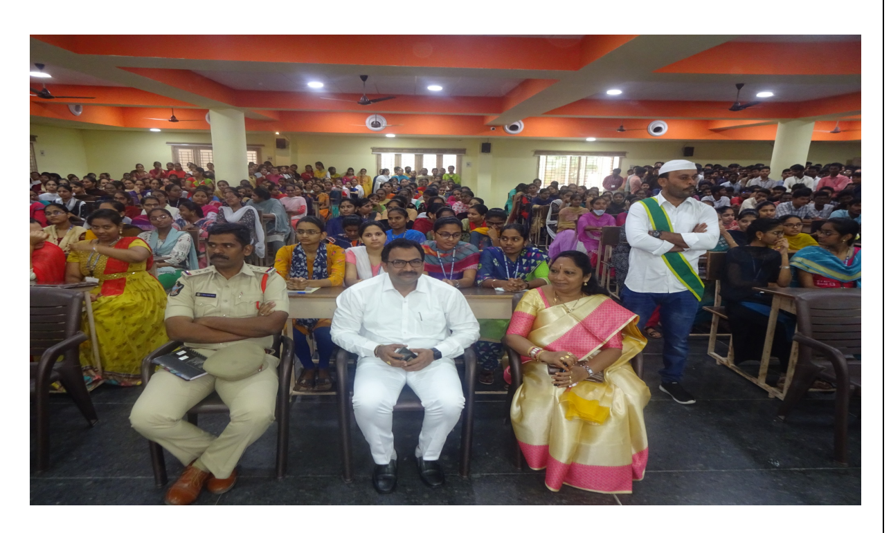
Disha Police and Magistrate of the District participated in the program