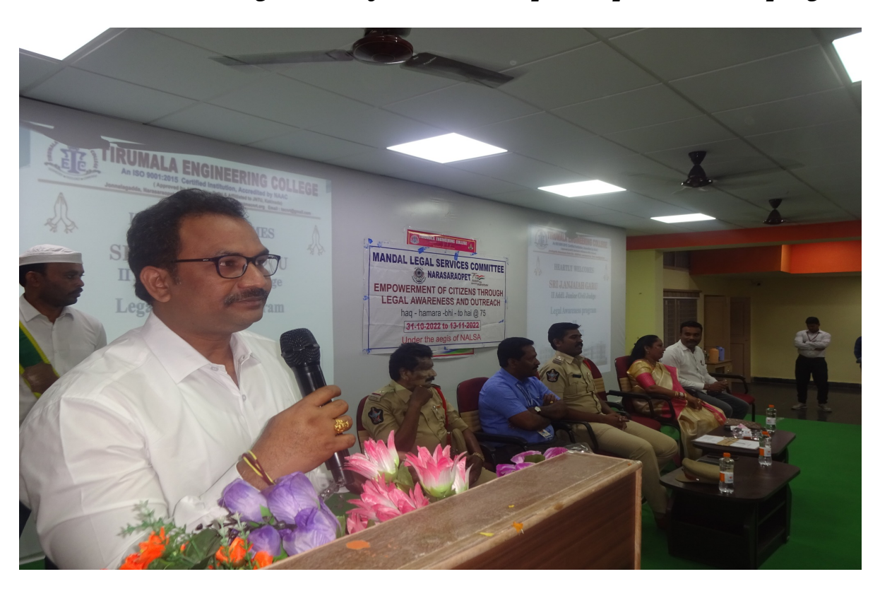
Disha Police and Magistrate of the District participated in the program