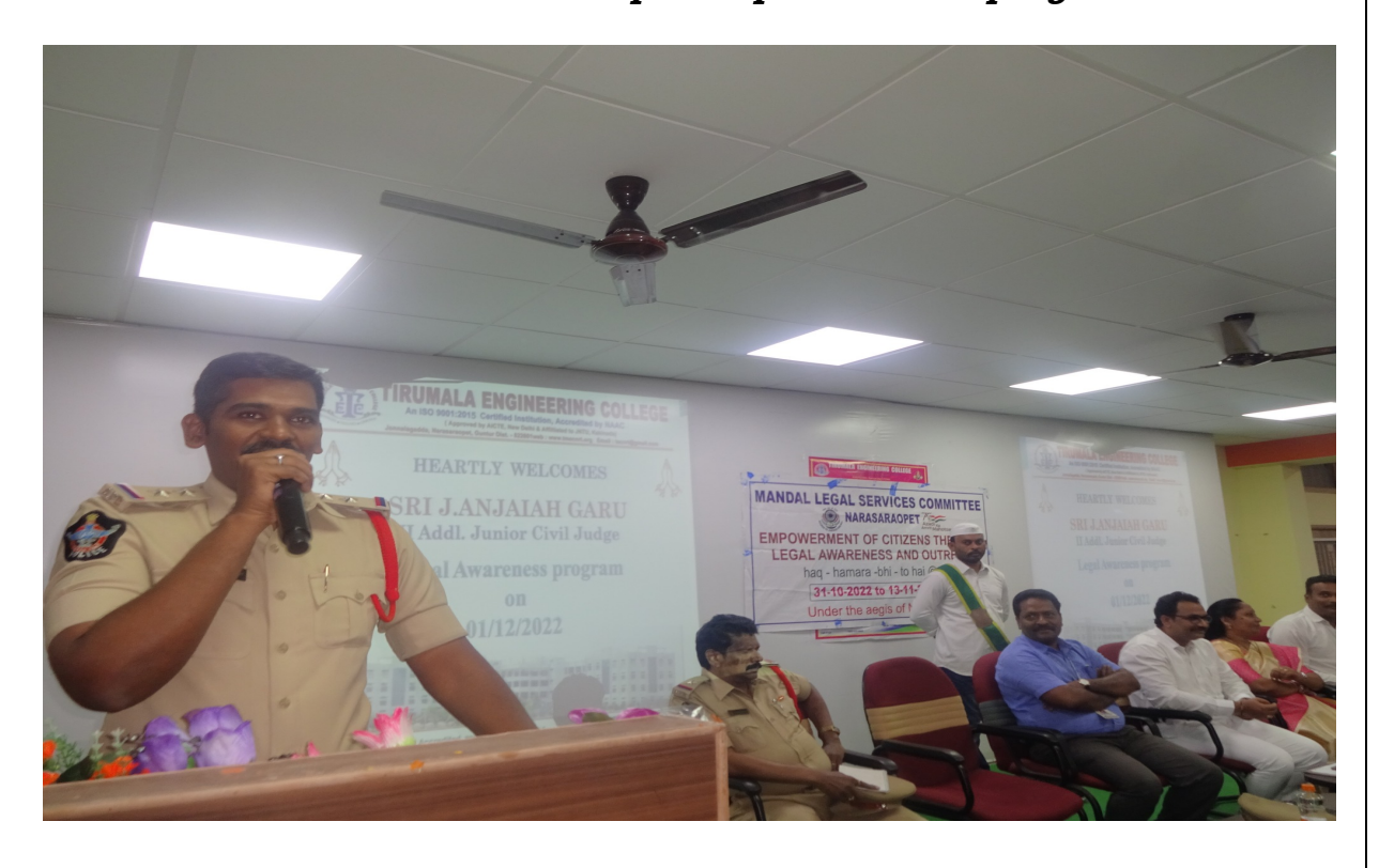
Disha Police and Magistrate of the District participated in the program